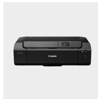
PIXMA PRO 200S